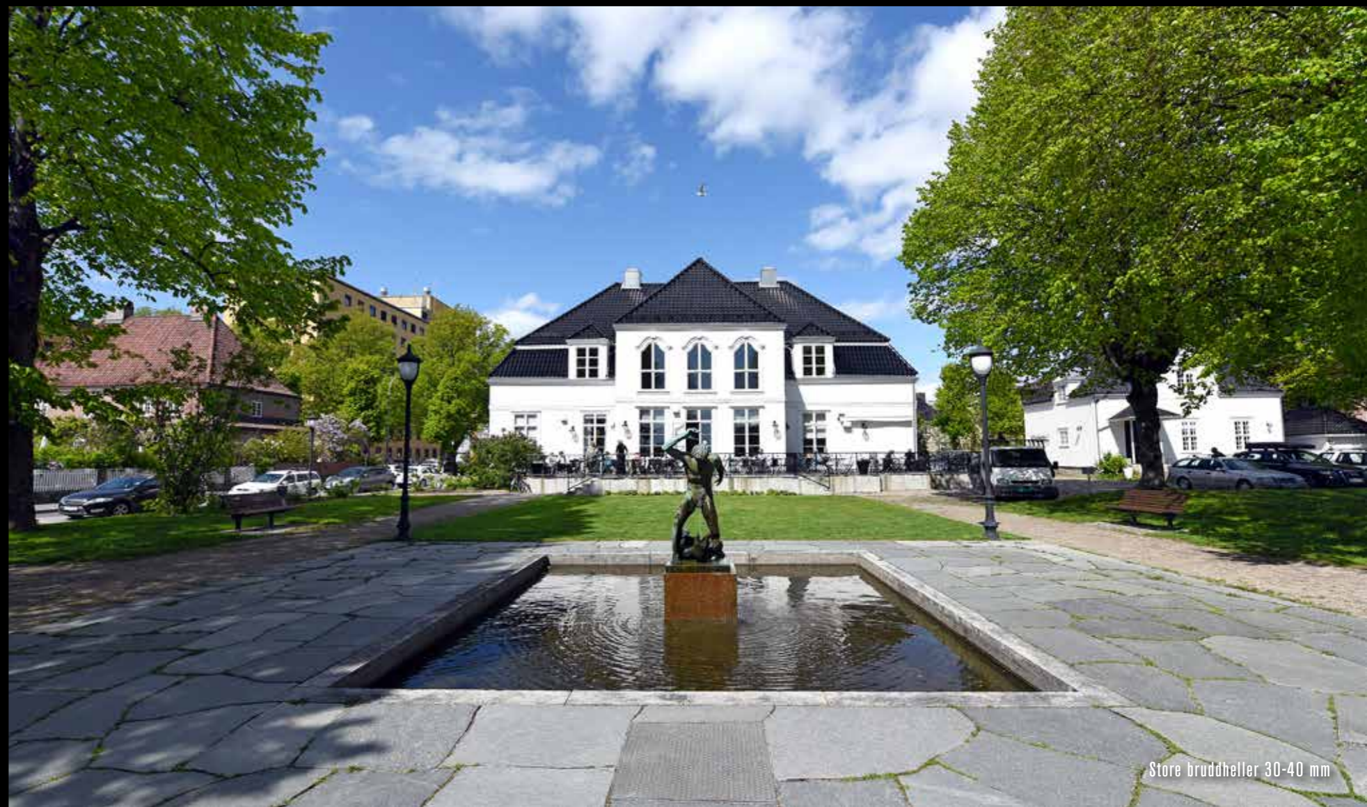
Store bruddheller 30-40 mm

OFFENTLIGE ROM - et godt førsteinntrykk som varer lenge