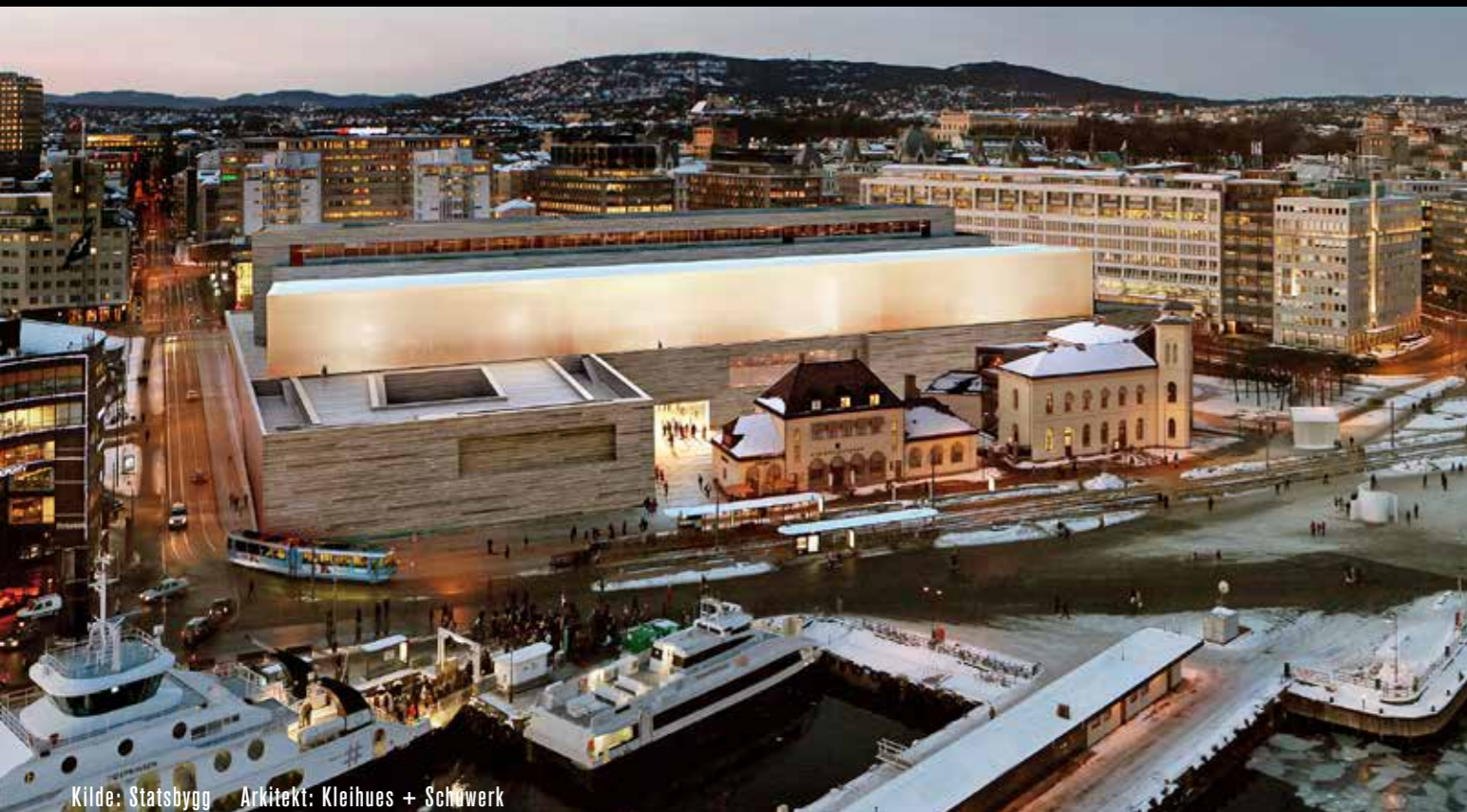
Kilde: Statsbygg Arkitekt: Kleihues + Schwark

Oppdal Sten er stolt leverandør av norsk skifer til Nasjonalmuseet