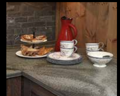
Skifer på kjøkkenet skaper trivsel og gir det et flott særpreg. Benkeplater i skifer er velegnet til baking.