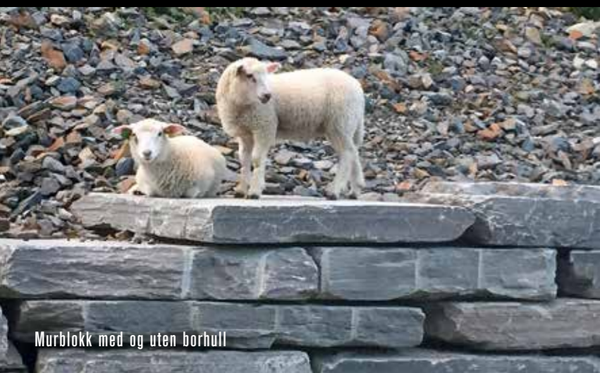
Murblokk med og uten borhull