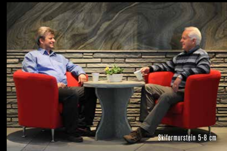
Skifermurstein 5-8 cm