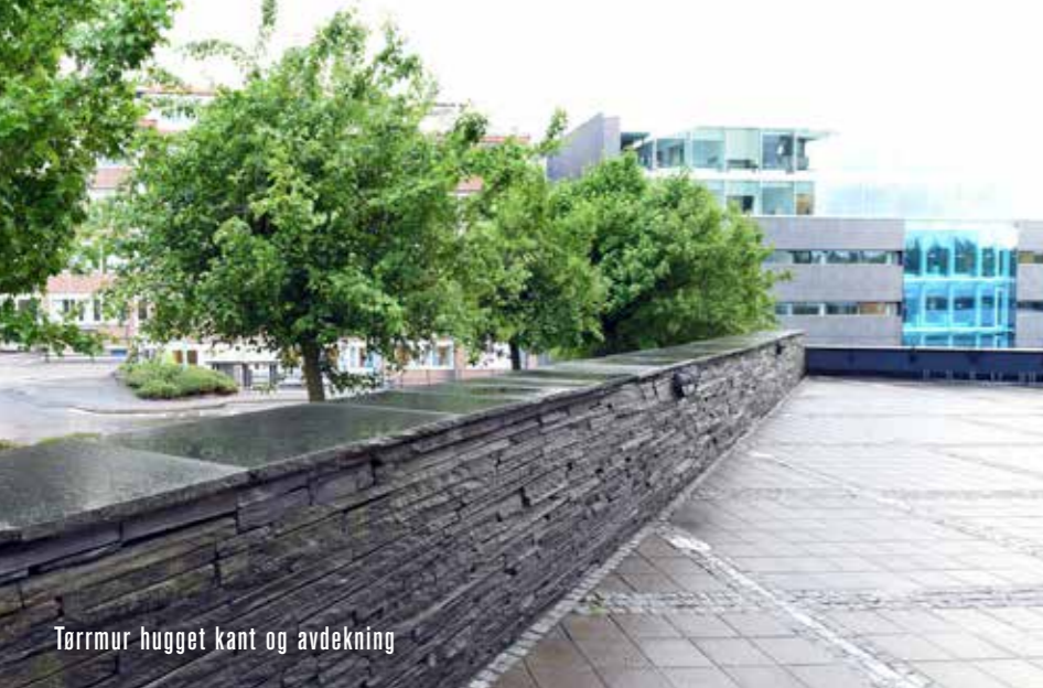
Tørrmur hugget kant og avdekning