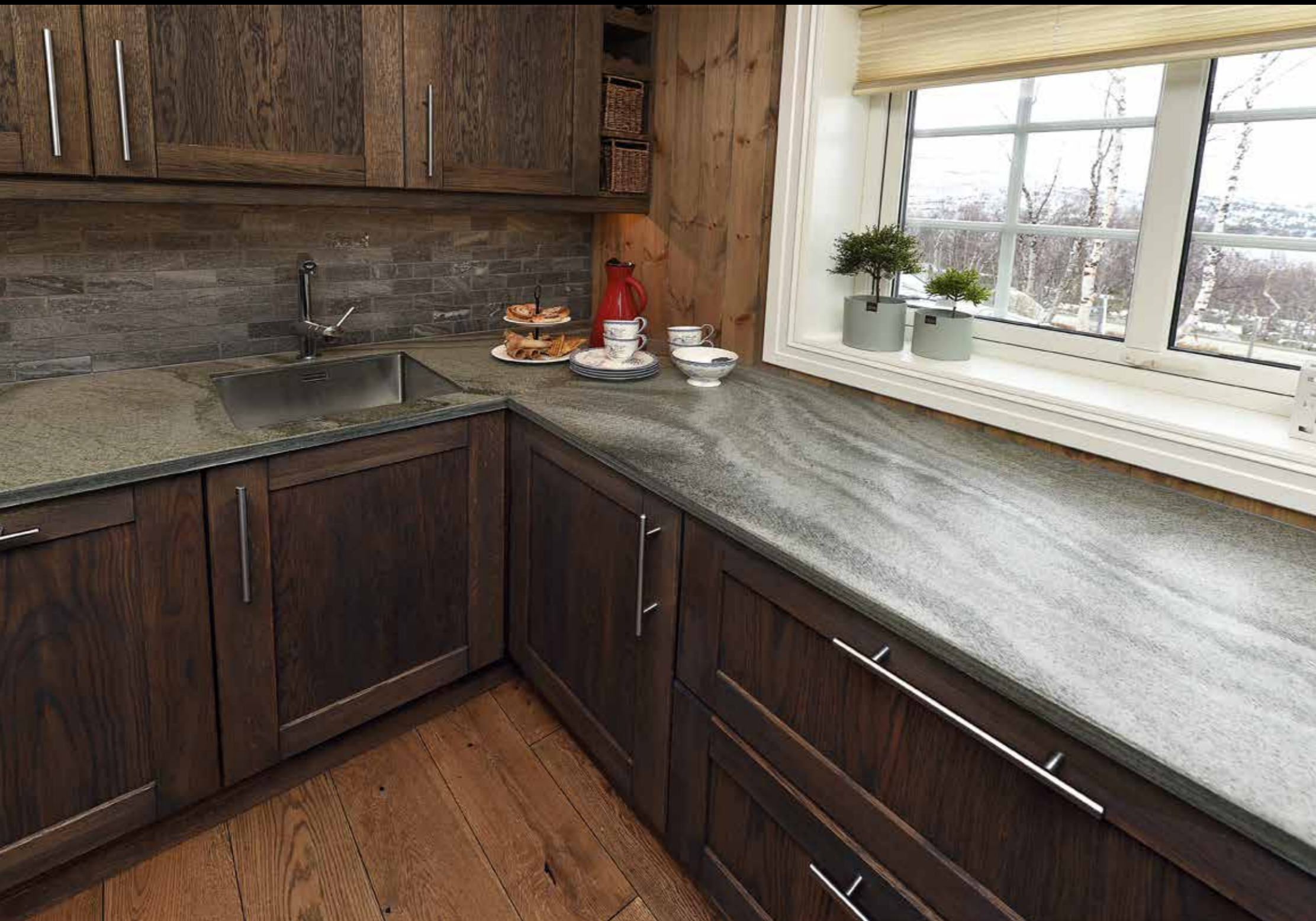
Oppdal Mørk Golan benkeplate i 30 mm, med børstet overflate