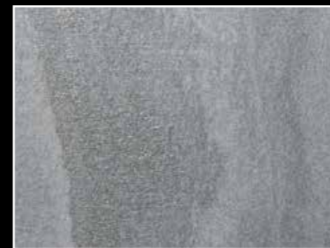
Oppdal Trollheimen, slipt