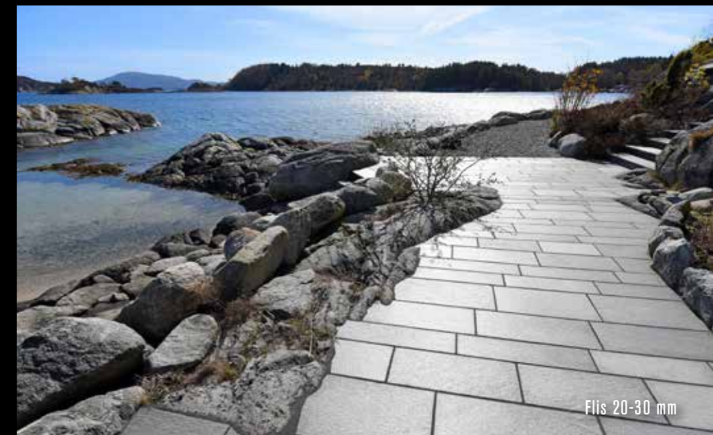
Flis 20-30 mm