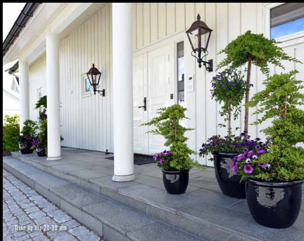
Trinn og flis 20-30 mm