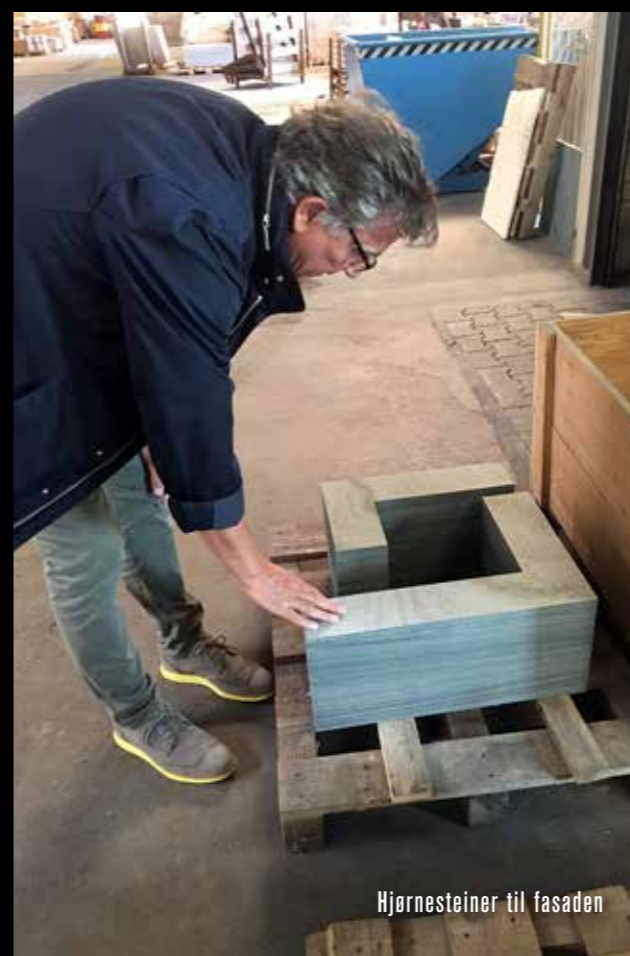
Hjørnesteiner til fasaden