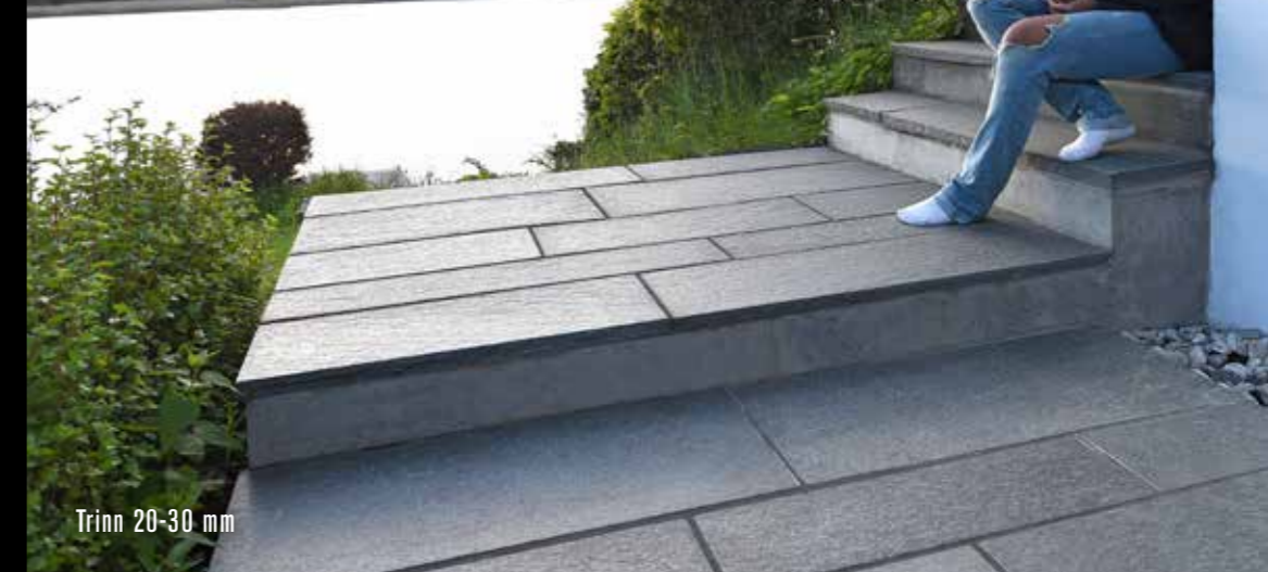
Trinn 20-30 mm