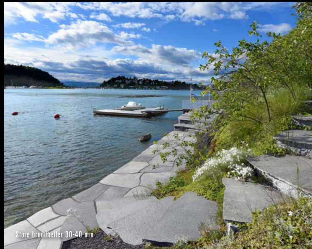
Store bruddheller 30-40 mm