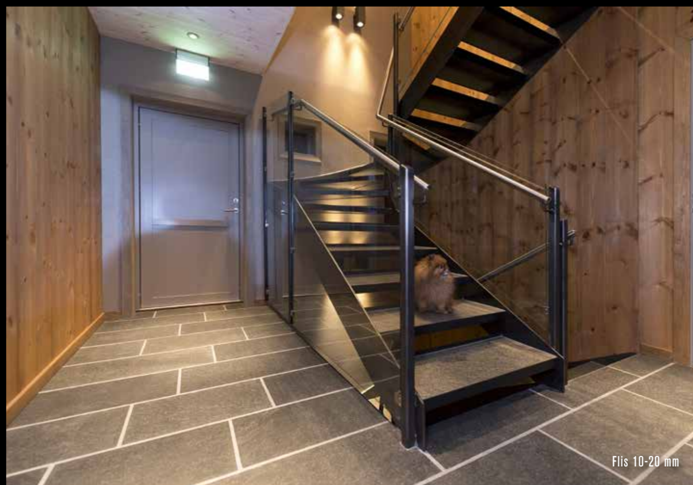
Flis 10-20 mm

INNENDØRS - et solid stykke natur mellom fire vegger