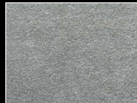
Oppdal Trollheimen, naturplan