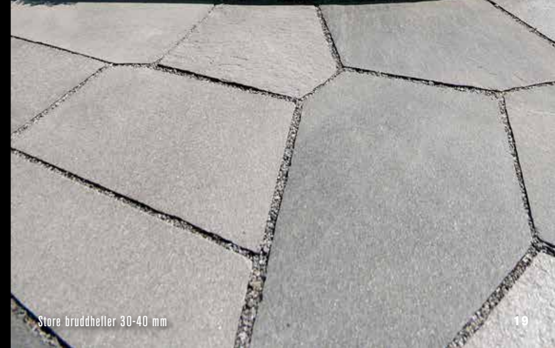
Store bruddheller 30-40 mm