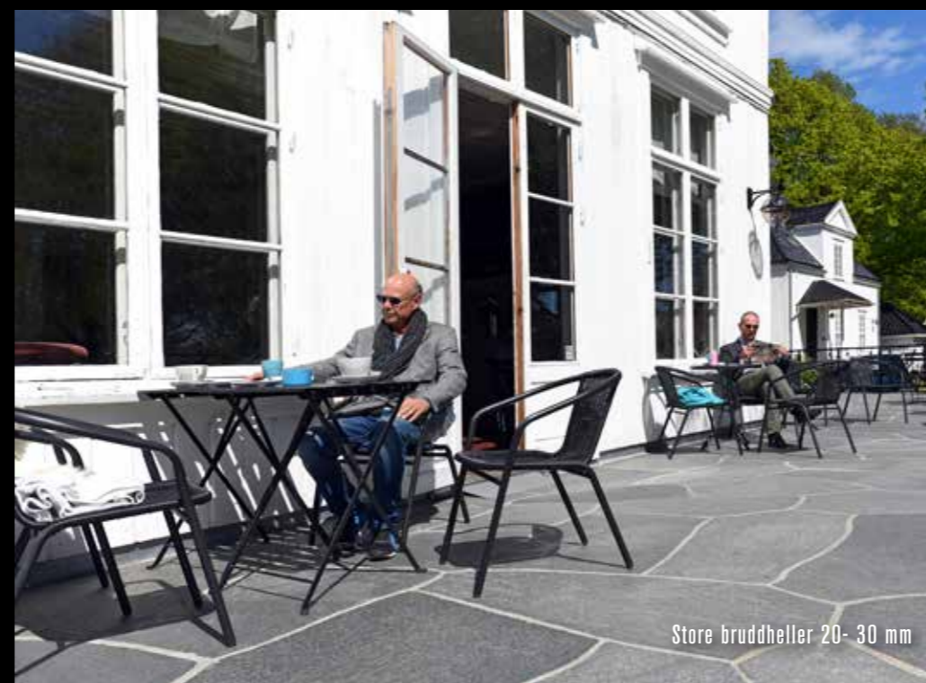
Store bruddheller 20- 30 mm