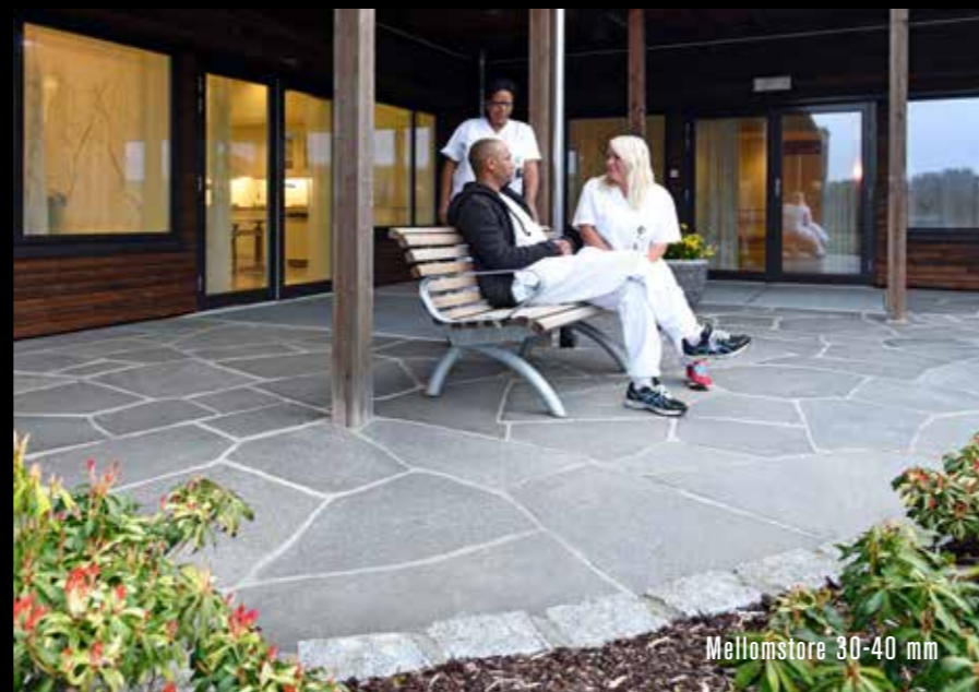
Mellomstore 30-40 mm