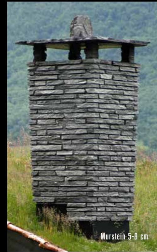
Murstein 5-8 cm