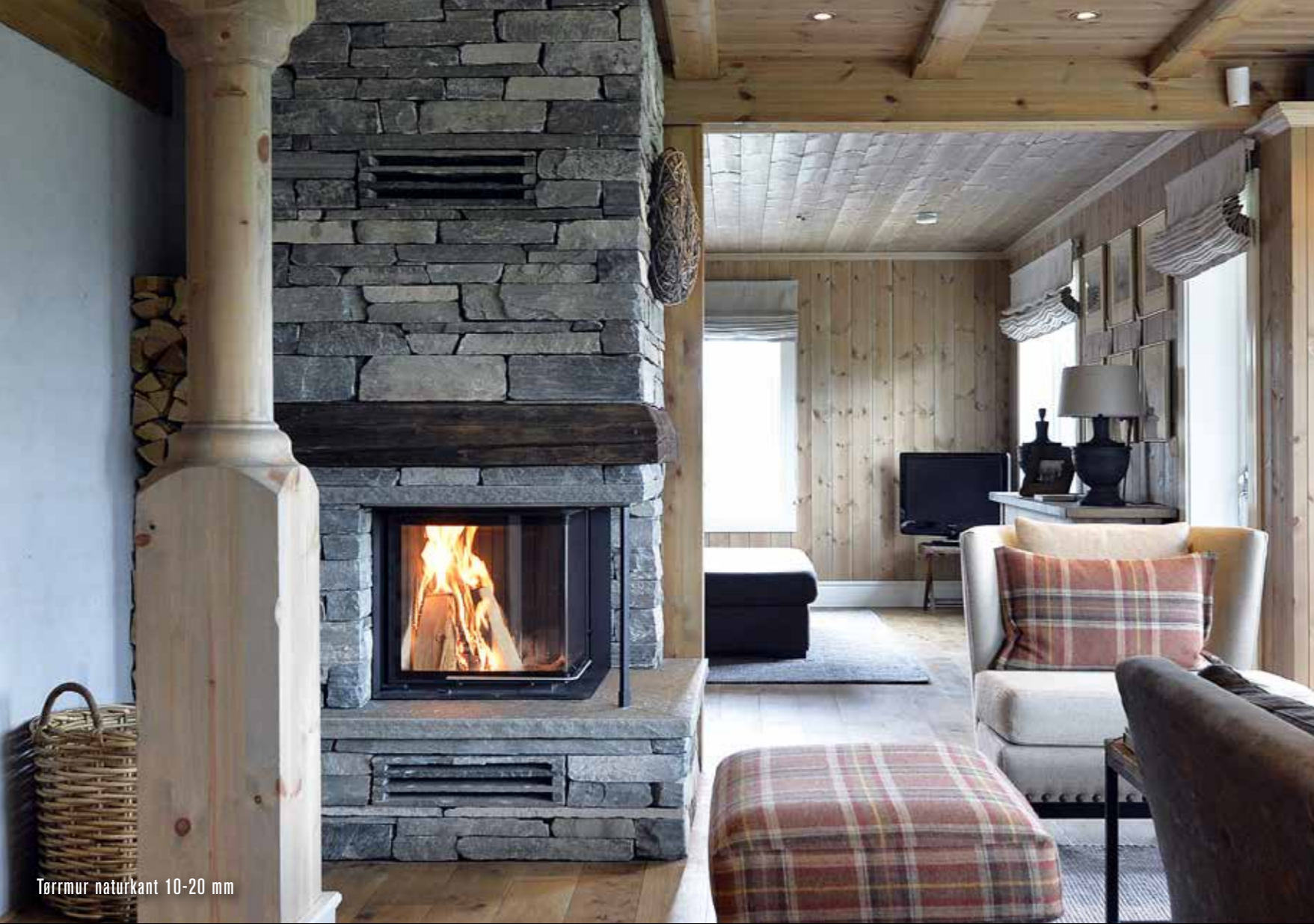
Tørrmur naturkant 10-20 mm