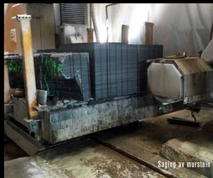
Saging av murstein

Nasjonalmuseet skal prydes i oppdalsskiferen Oppdal Mørk Golan!