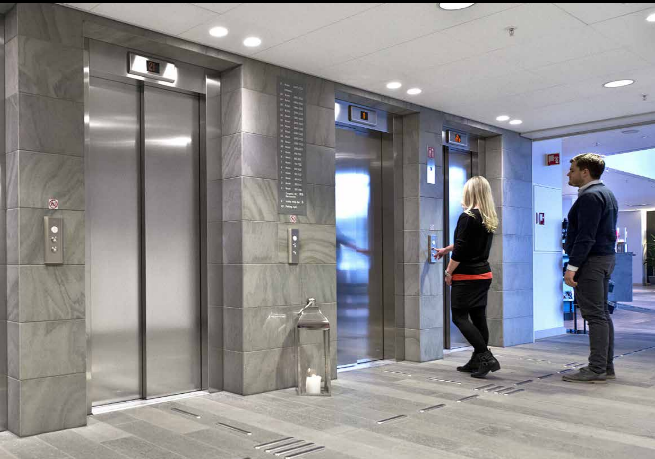
Oppdal Trollheimen flis slipt 30 cm i fallende lengder, i tykkelse 10 mm på vegg