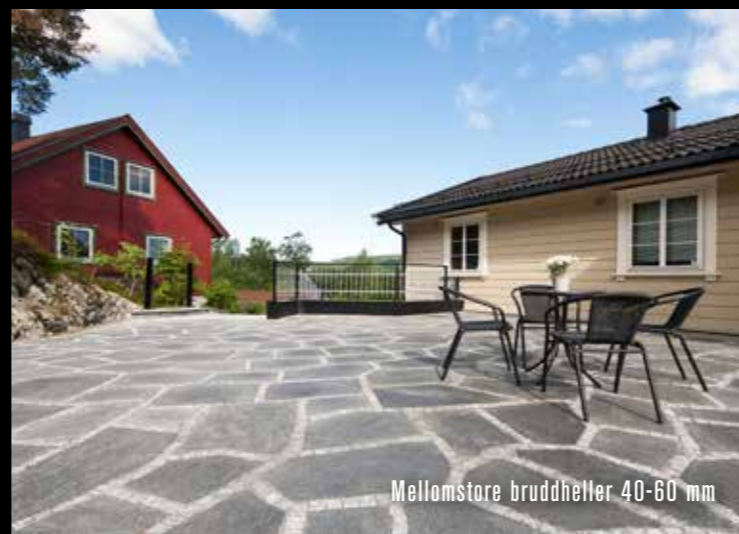
Mellomstore bruddheller 40-60 mm