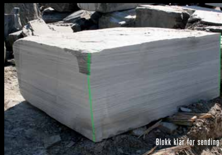
Blokk klar for sending