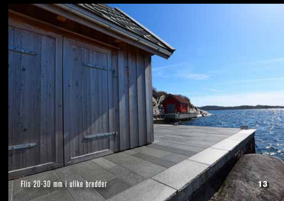
Flis 20-30 mm i ulike bredder