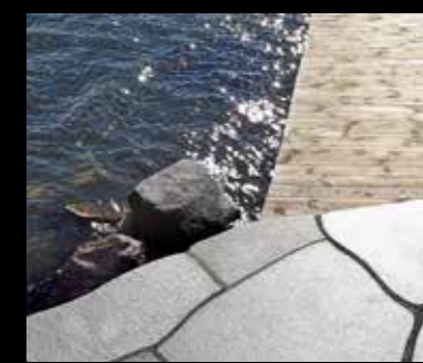
Skifer fra Oppdal Sten tåler ytre påkjenninger som sol og varme, regn og sjøvann, frost og snø.