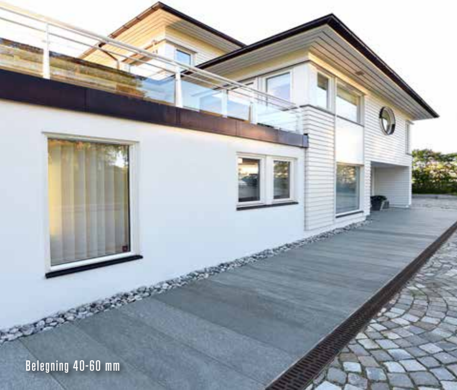
Belegning 40-60 mm