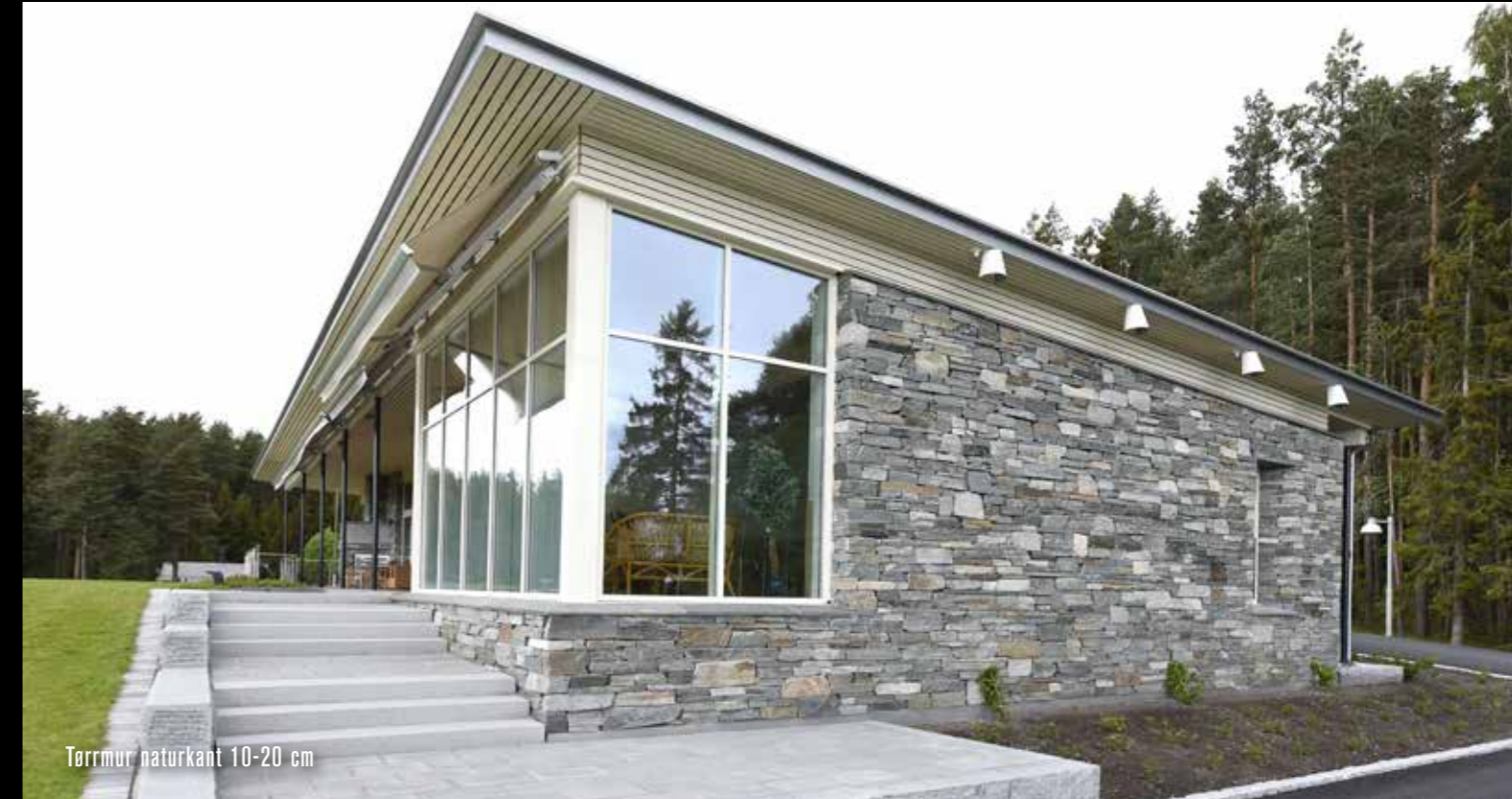
Tørrmur naturkant 10-20 cm