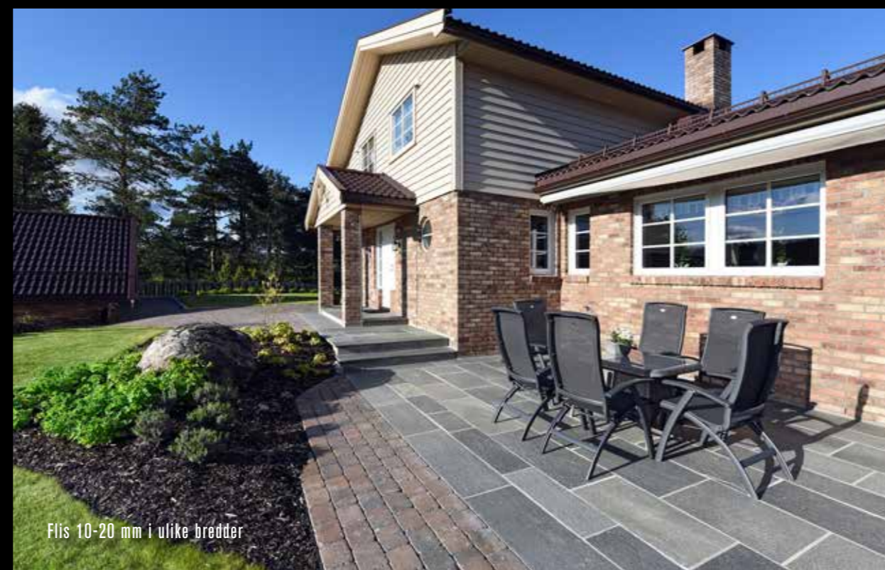
Flis 10-20 mm i ulike bredder