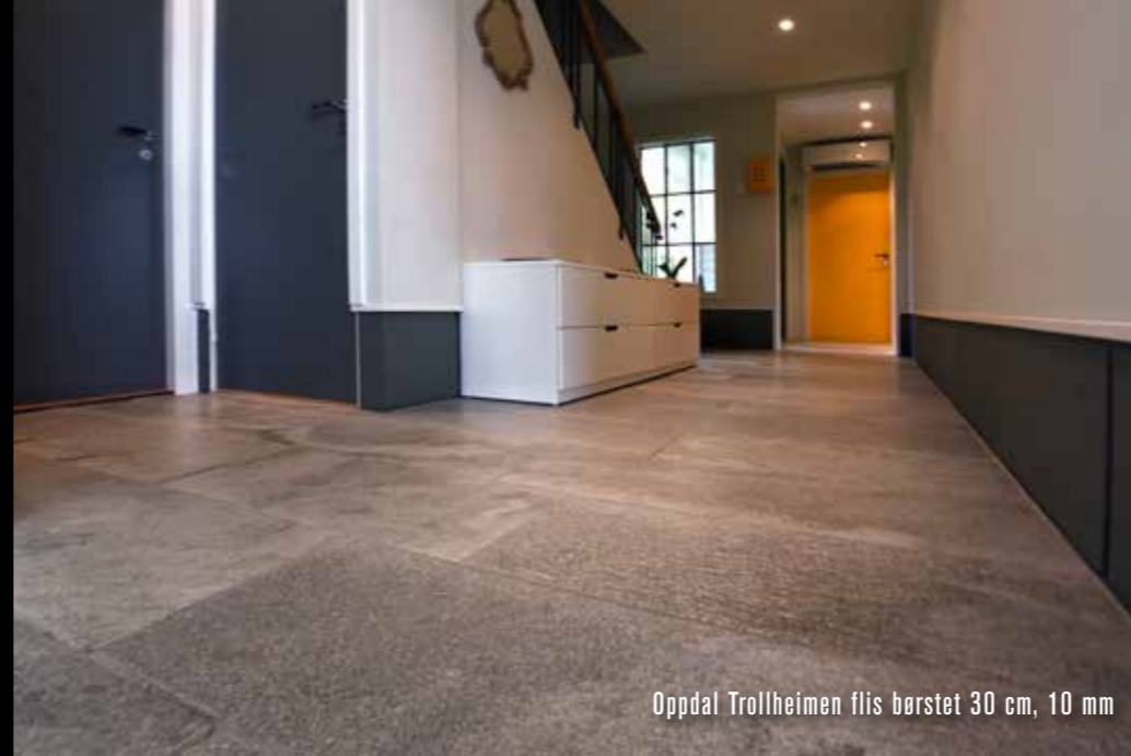
Oppdal Trollheimen flis børstet 30 cm, 10 mm

INNENDØRS - et solid stykke natur mellom fire vegger