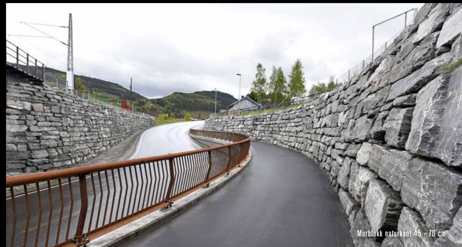
Murblokk naturkant 45 - 70 cm