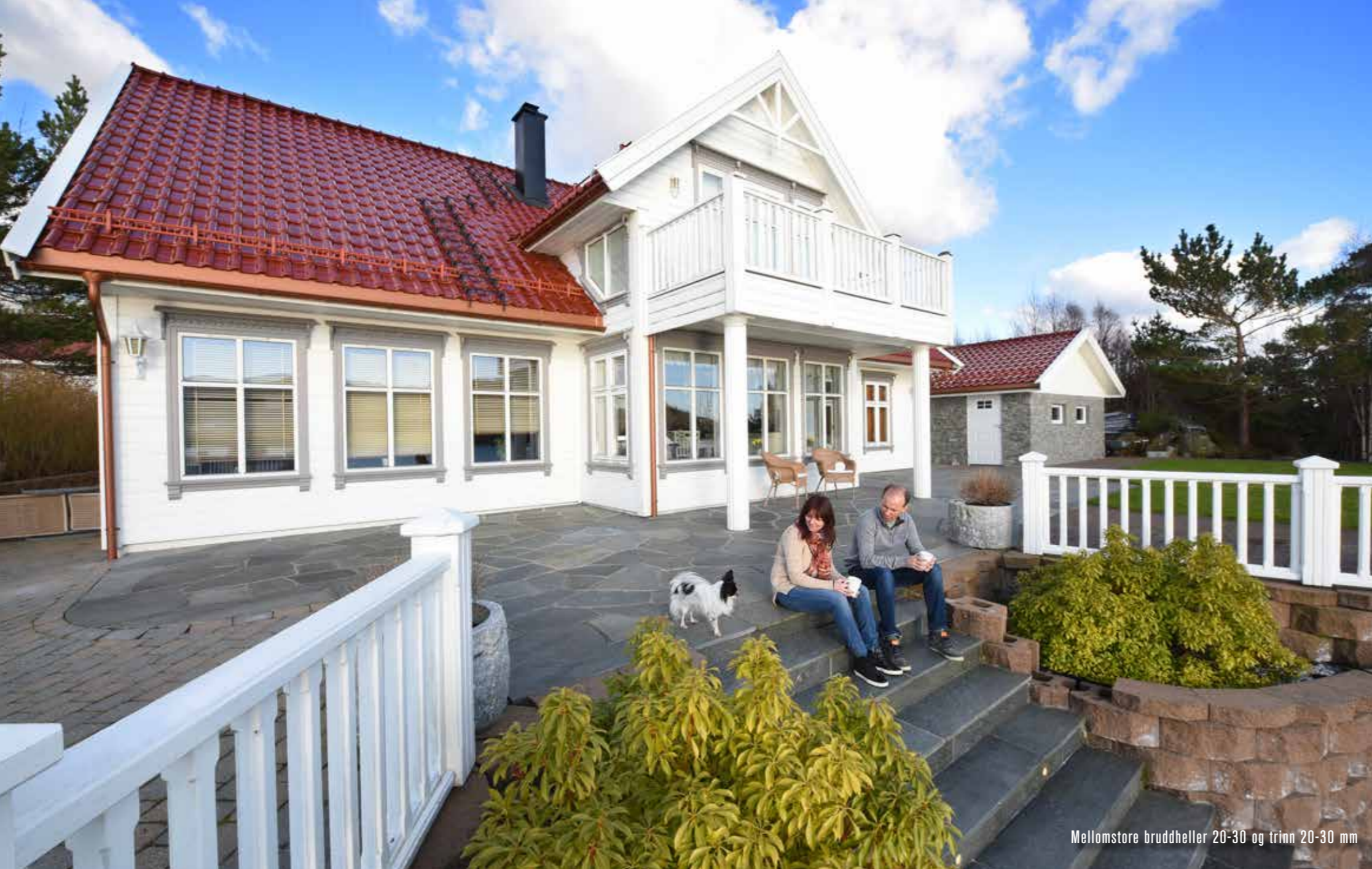
Mellomstore bruddheller 20-30 og trinn 20-30 mm