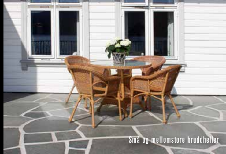
Små og mellomstore bruddheller