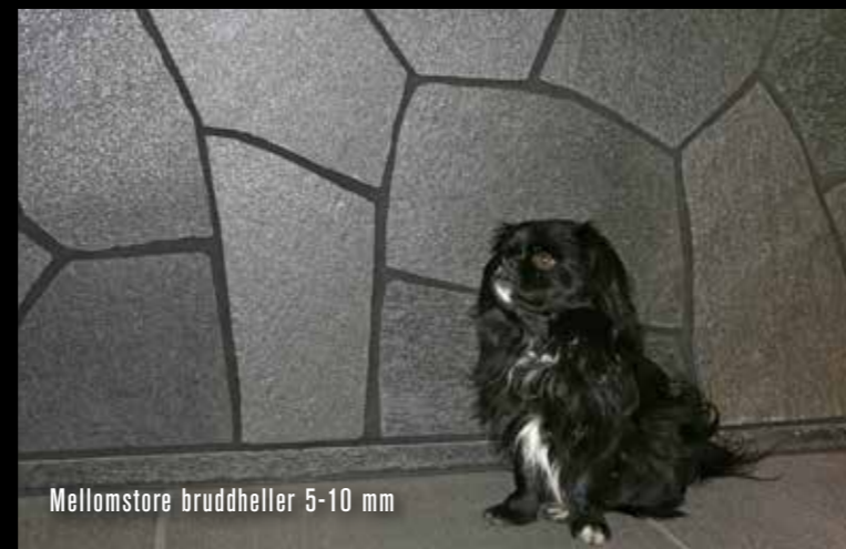
Mellomstore bruddheller 5-10 mm