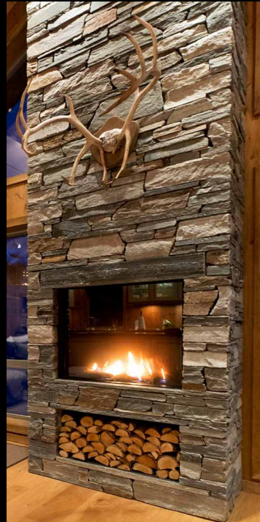
Tørrmur naturkant 5-12 cm