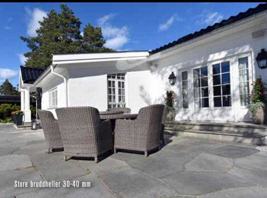
Store bruddheller 30-40 mm