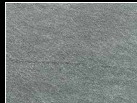
Oppdal Mørk, naturplan