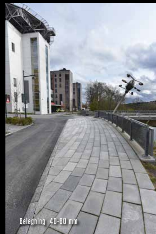
Belegning 40-60 mm