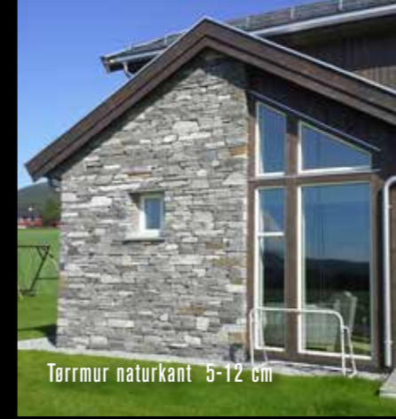
Tørrmur naturkant 5-12 cm

BOLIGFASADER - for moderne og tradisjonell arkitektur