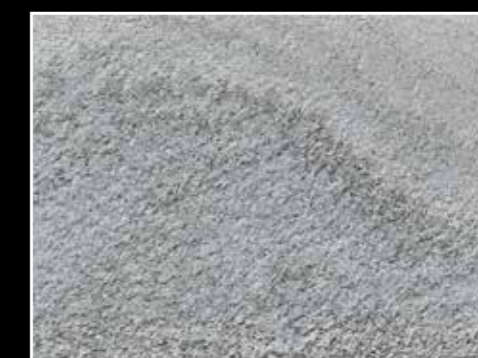
Oppdal Mørk Golan, børstet