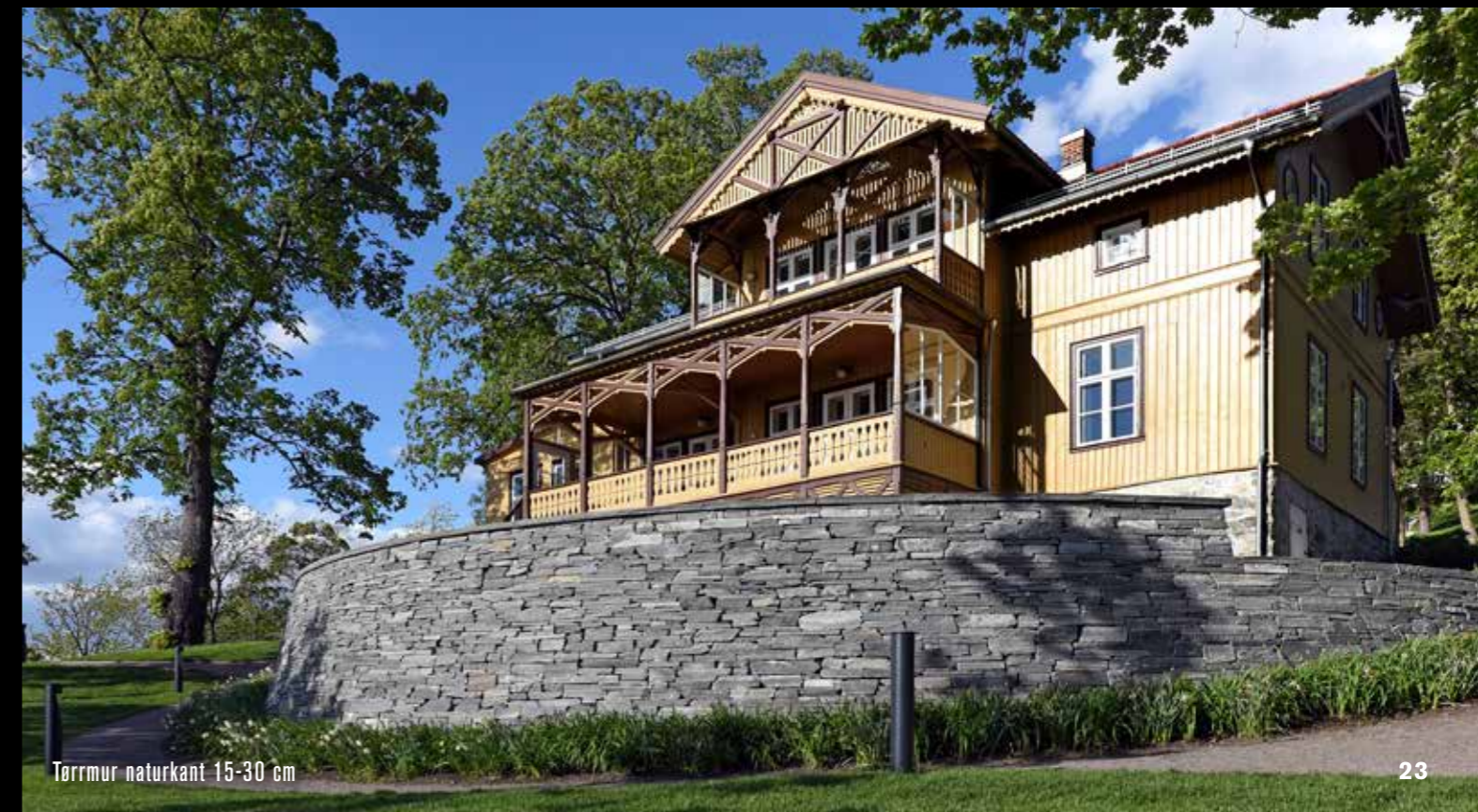
Tørrmur naturkant 15-30 cm