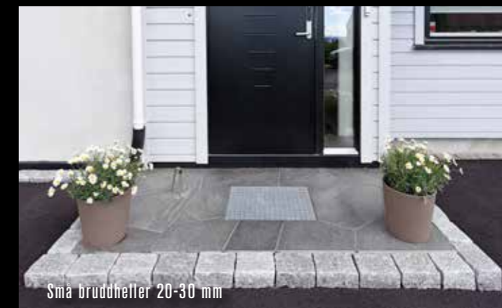
Sma bruddheller 20-30 mm