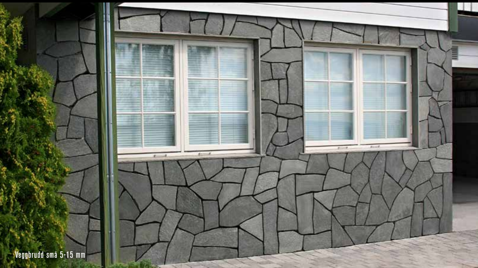
Veggbrudd små 5-15 mm