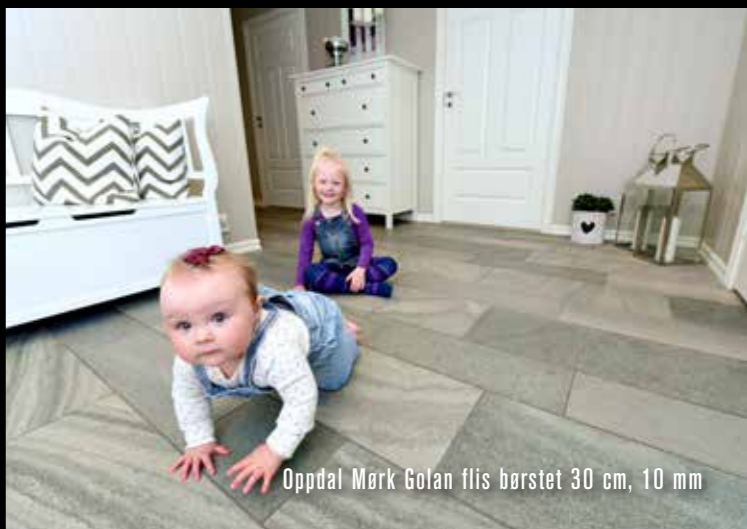
Oppdal Mørk Golan flis børstet 30 cm, 10 mm