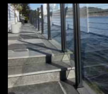
Skifer kombinert med glass og stål gir et flott og eksklusivt uttrykk.