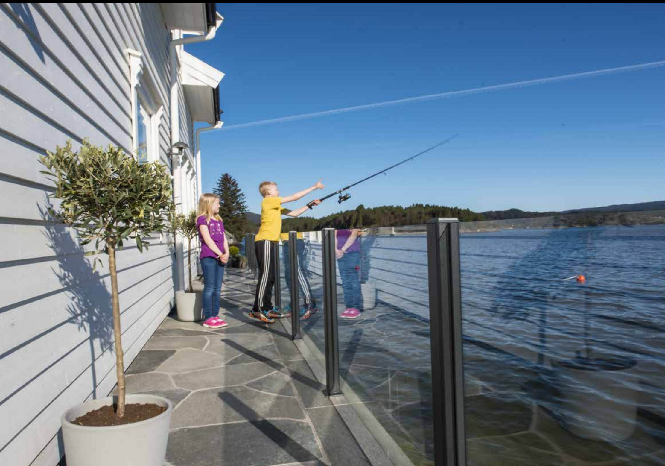
Mellomstore bruddheller 10-20 mm