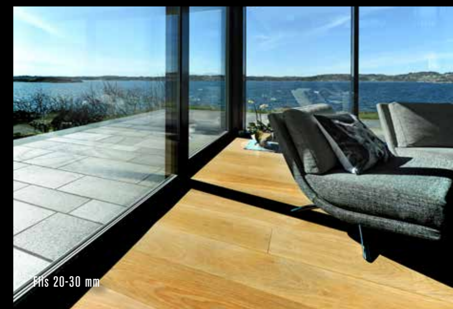
Flis 20-30 mm