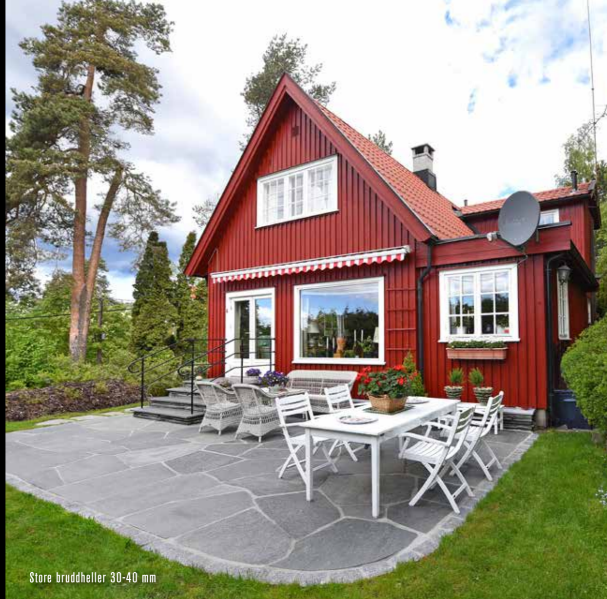
Store bruddheller 30-40 mm