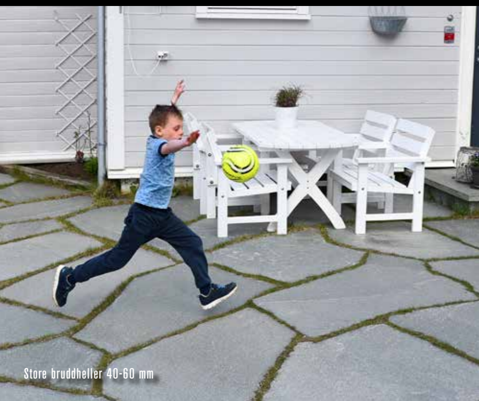
Store bruddheller 40-60 mm