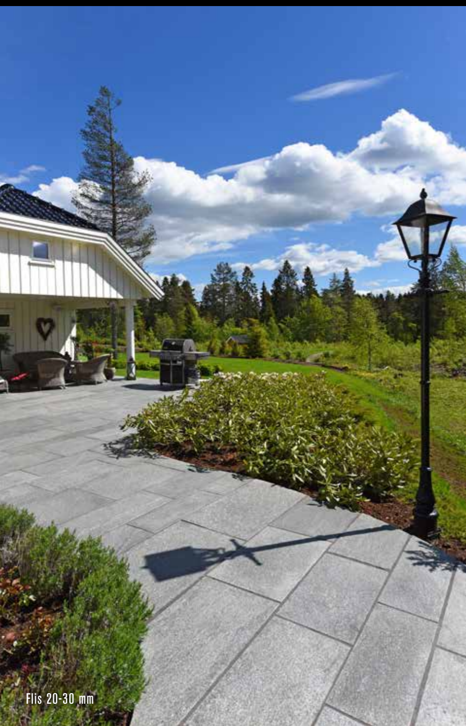
Flis 20-30 mm