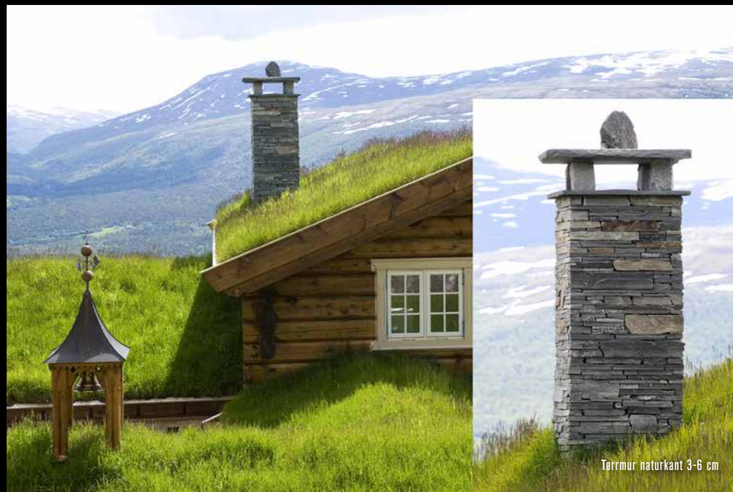
Tørrmur naturkant 3-6 cm