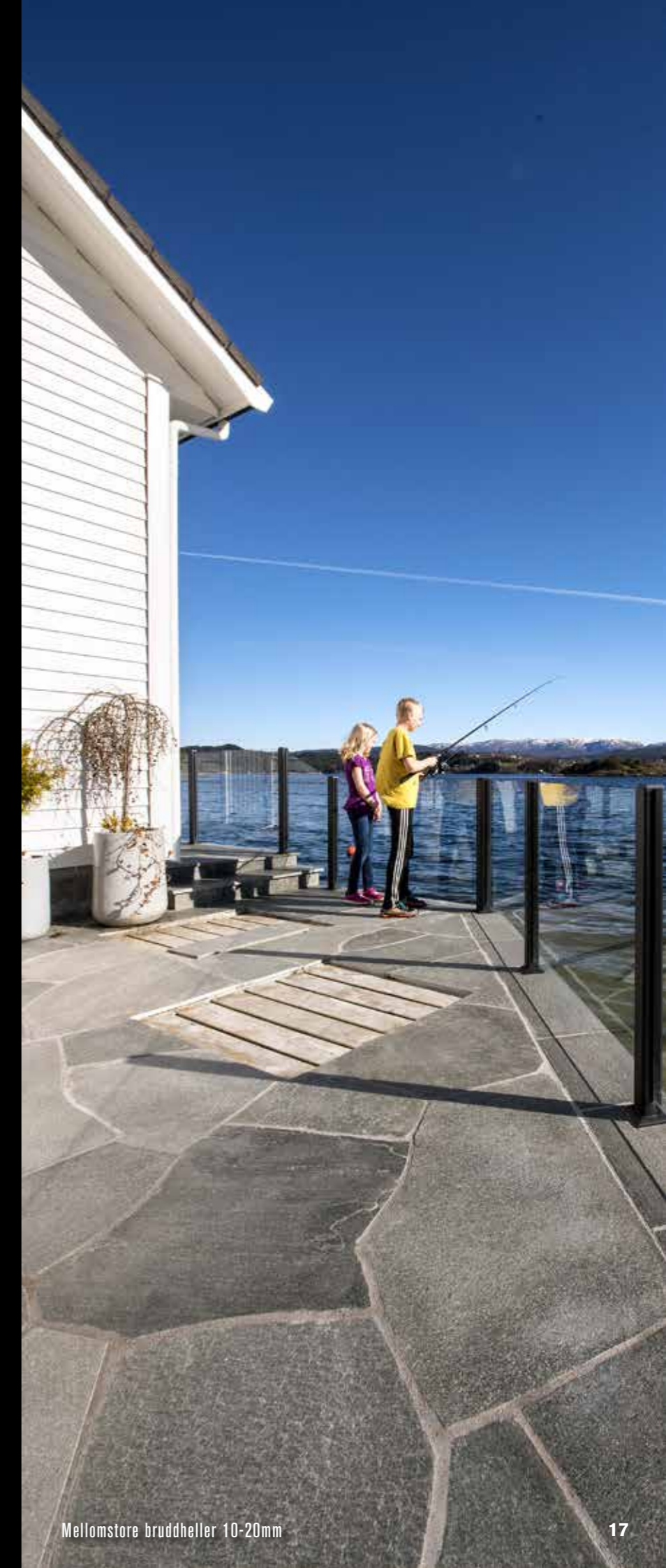
Mellomstore bruddheller 10-20mm