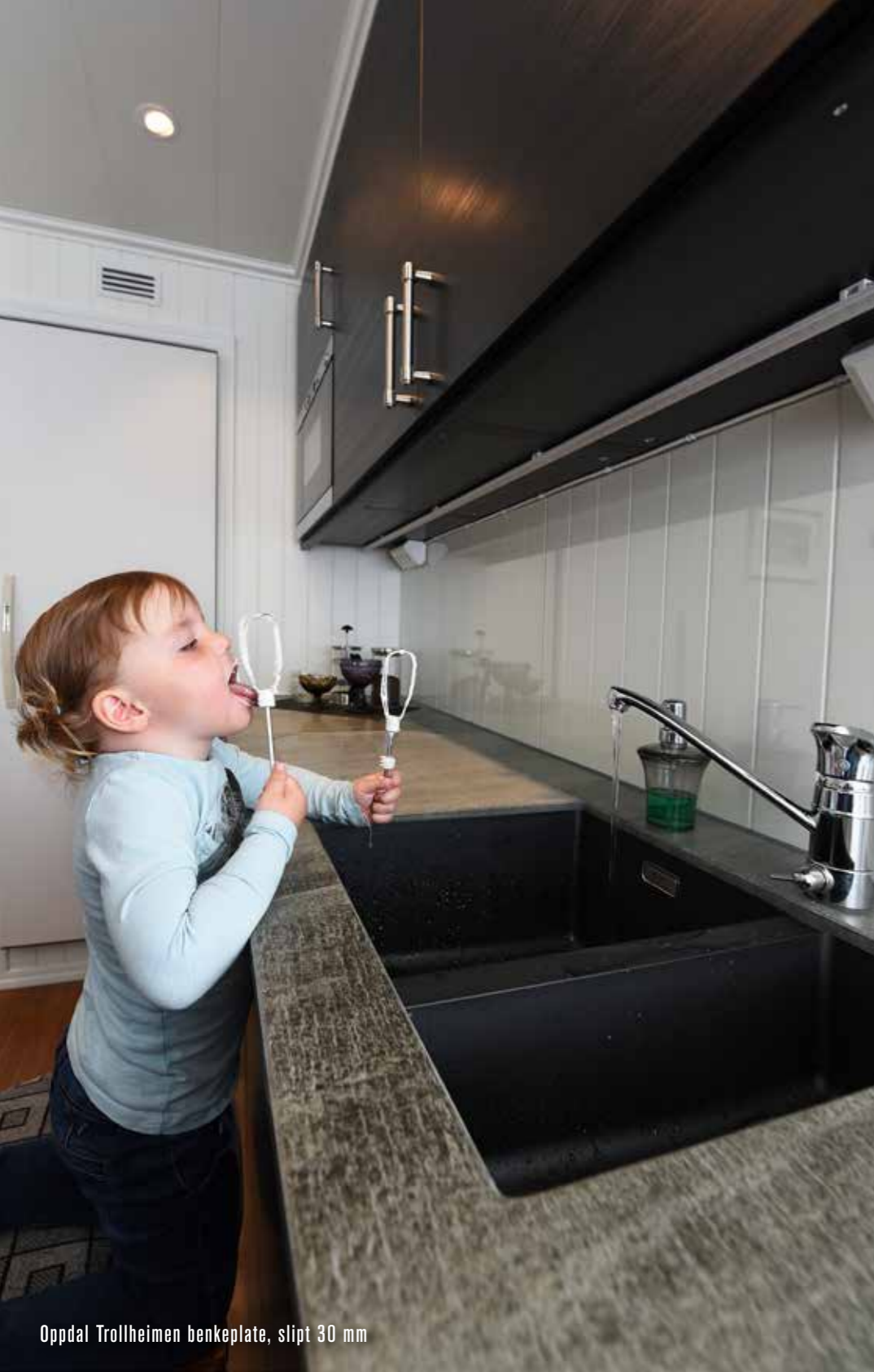
Oppdal Trollheimen benkeplate, slipt 30 mm