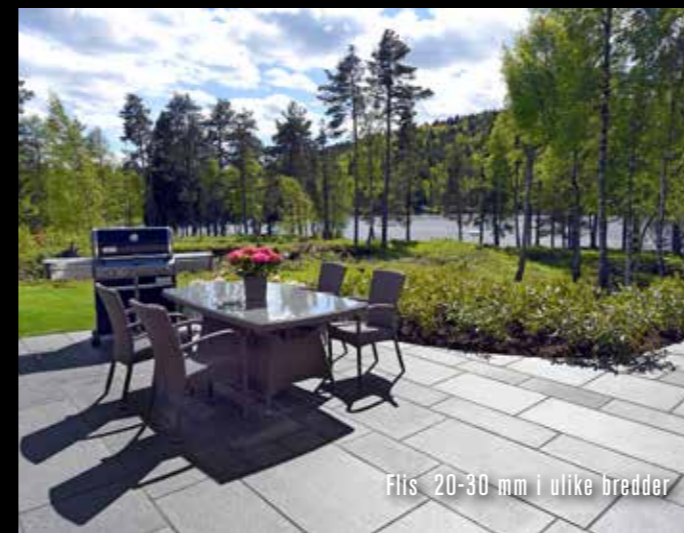
Flis 20-30 mm i ulike bredder