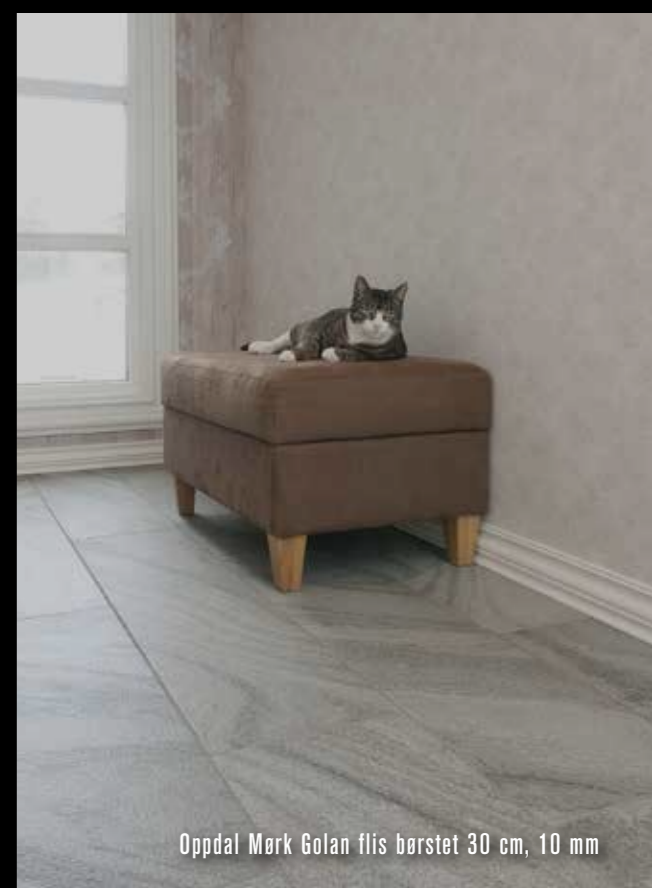
Oppdal Mørk Golan flis børstet 30 cm, 10 mm