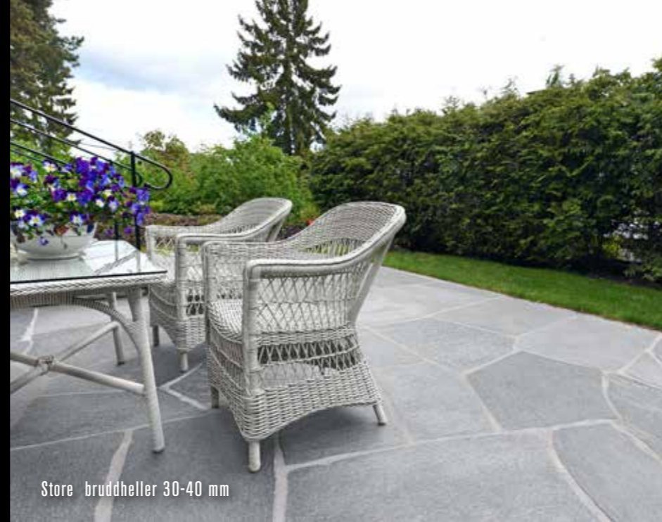
Store bruddheller 30-40 mm