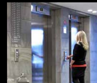
Oppdalskifer er velegnet til bruk i det offentlige rom både inne og ute.