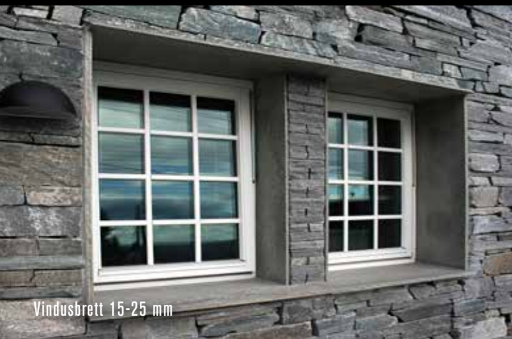
Vindusbrett 15-25 mm

BOLIGFASADER - for moderne og tradisjonell arkitektur