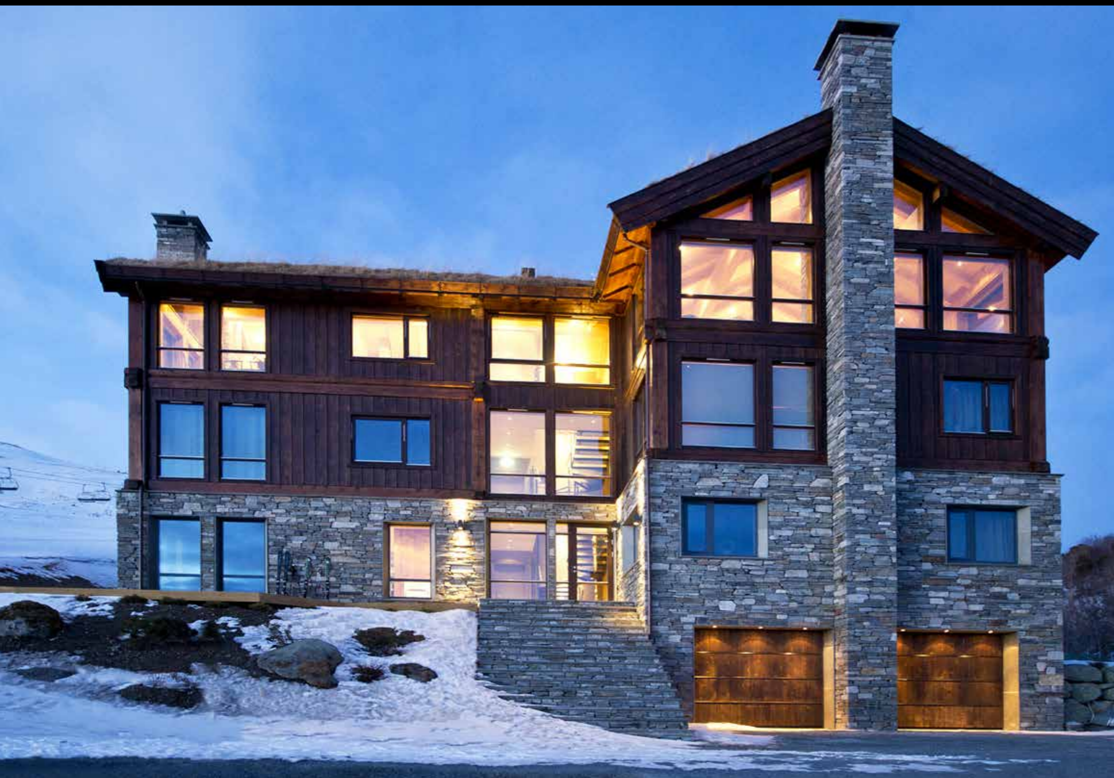
Tørrmur med naturkant kombinert med tørrmur med hugget kant i dybde 10-20 cm