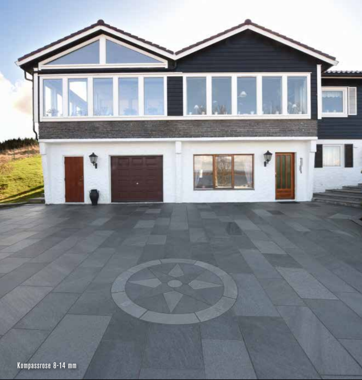
Kompassrose 8-14 mm