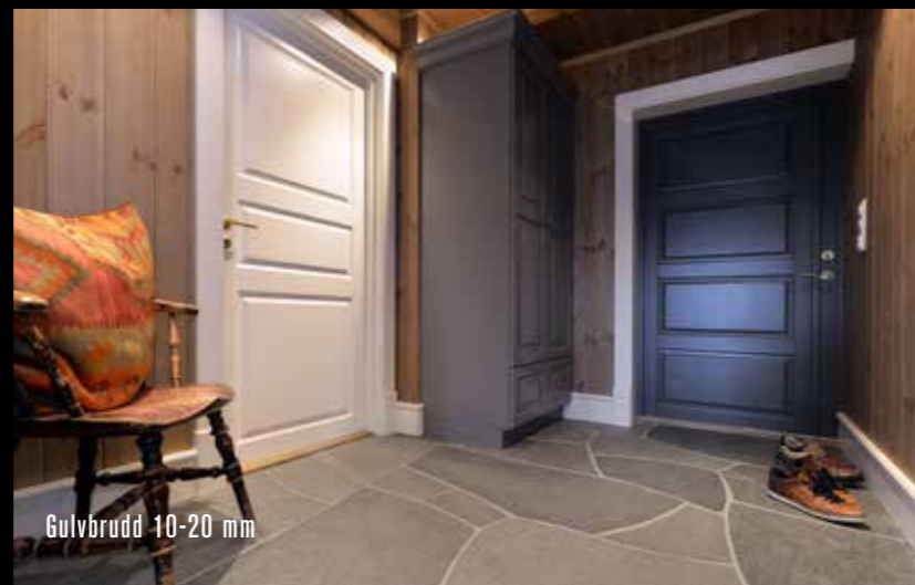
Gulvbrudd 10-20 mm