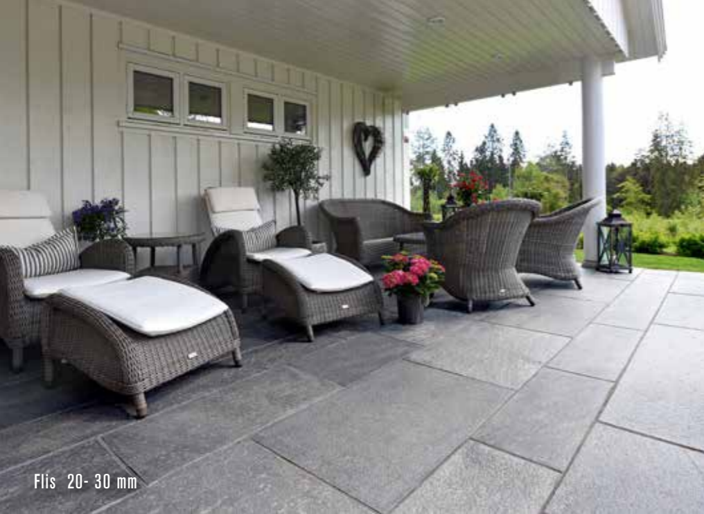
Flis 20-30 mm