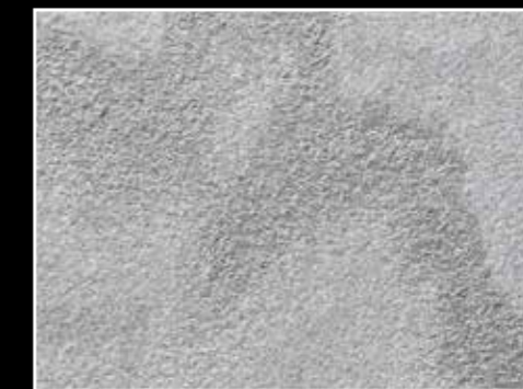
Oppdal Trollheimen, børstet