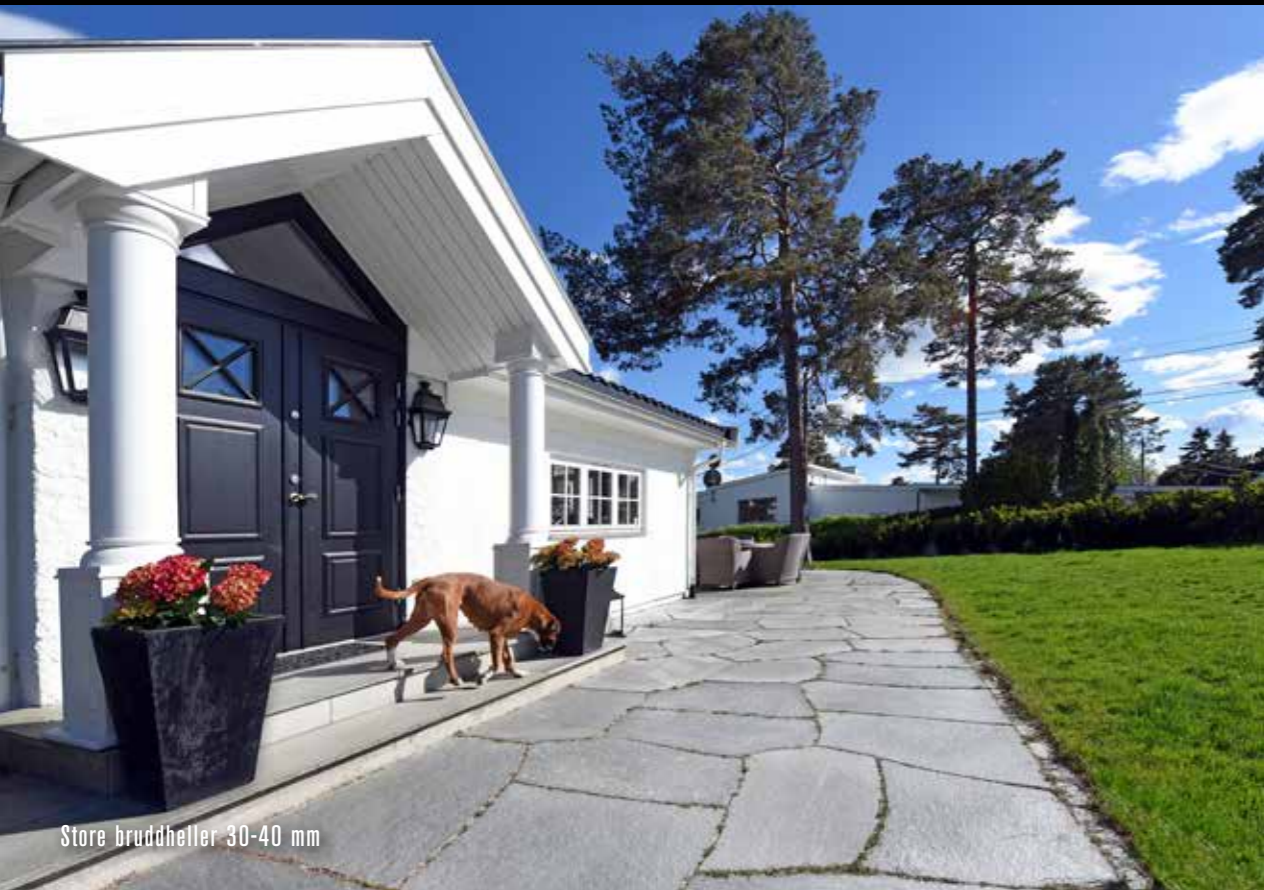
Store bruddheller 30-40 mm