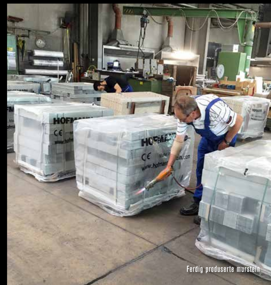
Ferdig produserte murstein