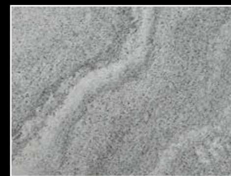
Oppdal Mørk Golan, slipt