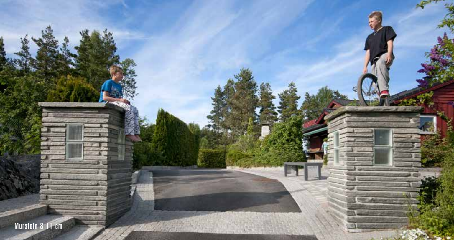
Murstein 8-11 cm