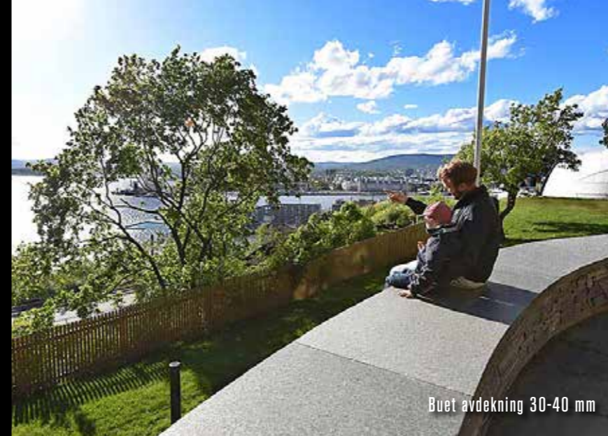
Buet avdekning 30-40 mm

OFFENTLIGE ROM - et godt førsteinntrykk som varer lenge