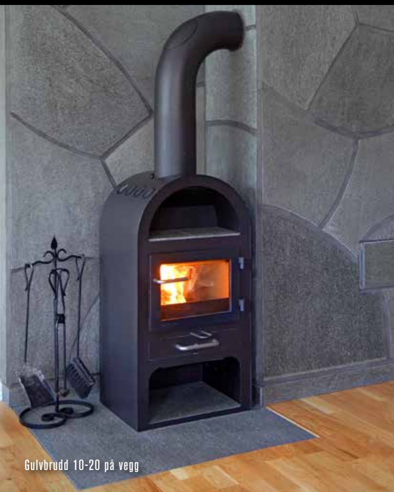
Gulvbrudd 10-20 på vegg