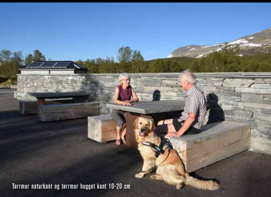
Tørrmur naturkant og tørrmur hugget kant 10-20 cm

OFFENTLIGE ROM - et godt førsteinntrykk som varer lenge